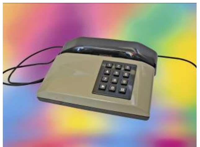
Telefono moderno della ditta ITALTEL (ex Siemens) tipo "PULSAR" degli anni 1980.