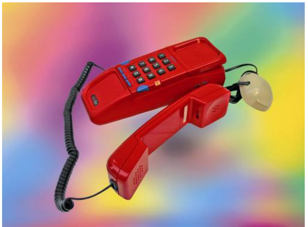
Telefono moderno della ditta BRONDI tipo "SPIDER" lanciato in occasione dei Campionati Mondiali Calcio di ITALIA '90.