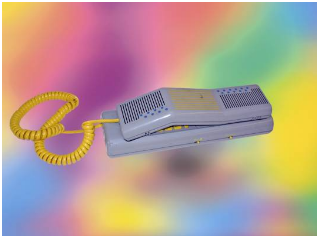
Telefono moderno della ditta SWATCH tipo "TWIN PHONE" degli anni millenovecentonovanta.