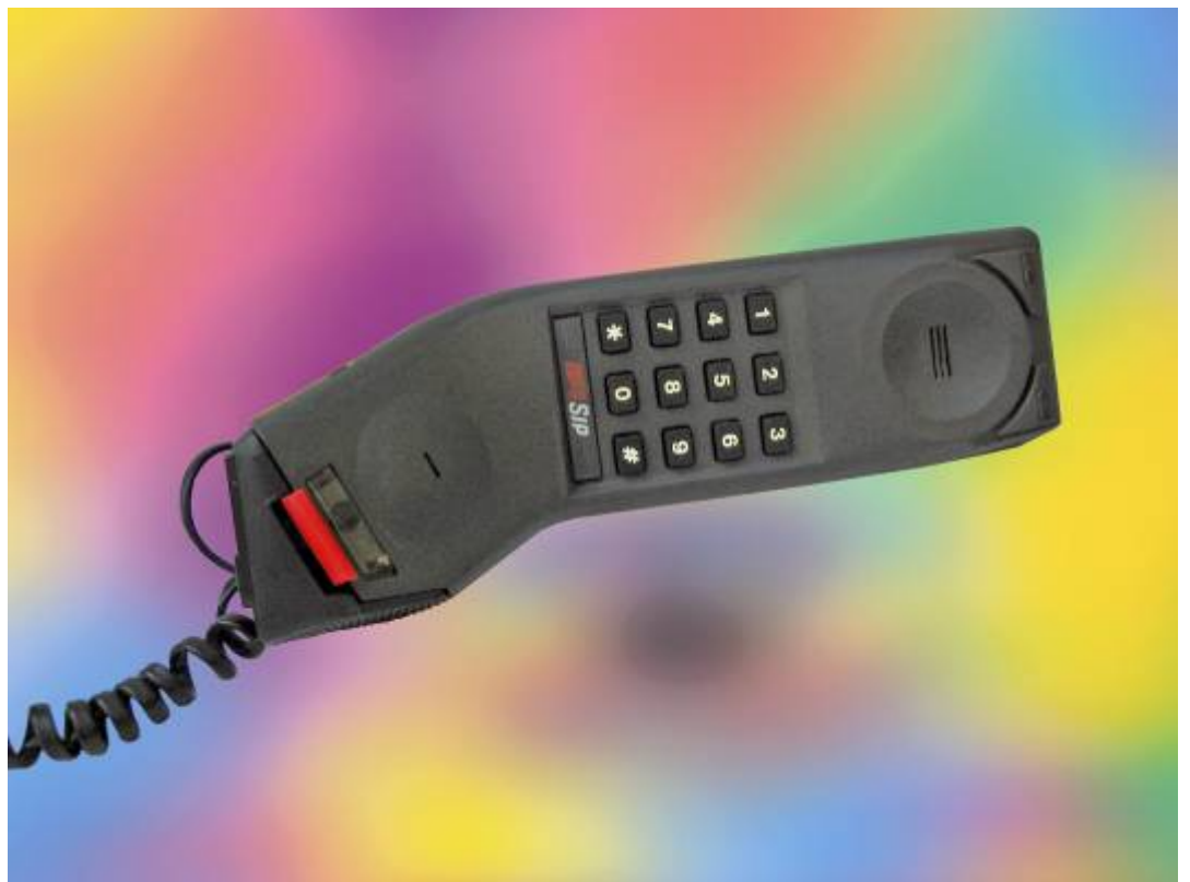
Telefono moderno della ditta ITALTEL (ex Siemens) tipo "COBRA" degli anni millenovecentottanta.