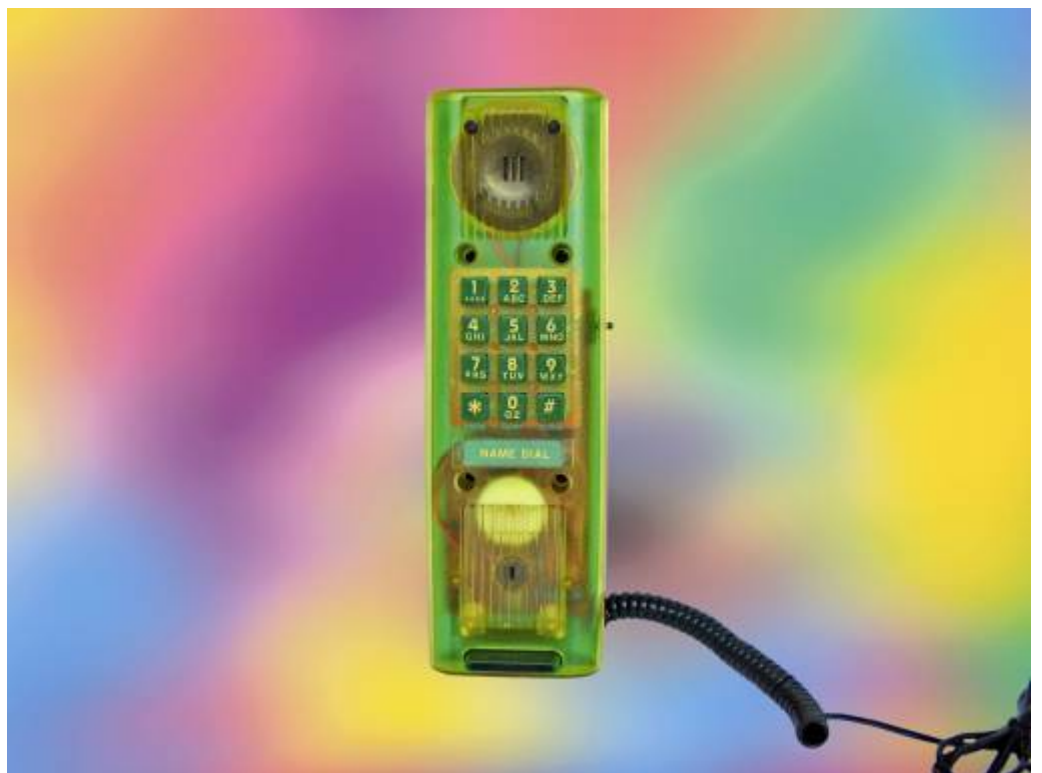
Telefono verde di "BUONA DOMENICA", trasmissione televisiva presentata da Gabriella Carlucci. Ditta sconosciuta, è degli anni millenovecentonovanta.