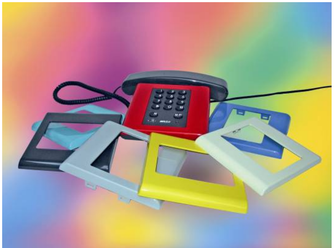
Telefono della ditta URMET tipo "ELITE" con Cover intercambiabili degli anni millenovecentonovanta.