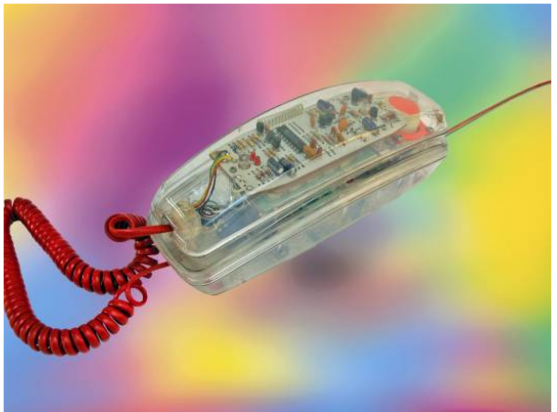
Telefono trasparente della ditta RONSON simile al telefono Gondola degli anni millenovecentosessanta.